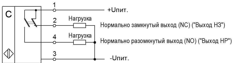
Рис.1 - Схема подключения

Датчики в заводской упаковке могут транспортироваться автомобильным, железнодорожным, водным и воздушным транспортом (в том числе самолетом без специальной герметизации грузовых отсеков на высотах до 17000 метров) без ограничения дальности перевозок, взлетов и посадок.